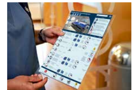
Anwendungstechnik und Workflows